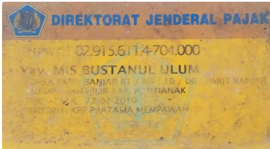
FOTO COPY NPWP LEMBAGA

Sekretariat: Jln. Parit Banjar Kecamatan Mempawah Timur Kabupaten Mempawah 78915 Hp. 0857 5231 6126