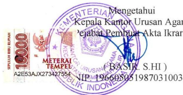
( BASIR. S.HI )

Kepala Kantor Urusan Agama Kecamatan/ pejabat Pembuat Akta Ikrar Wakaf