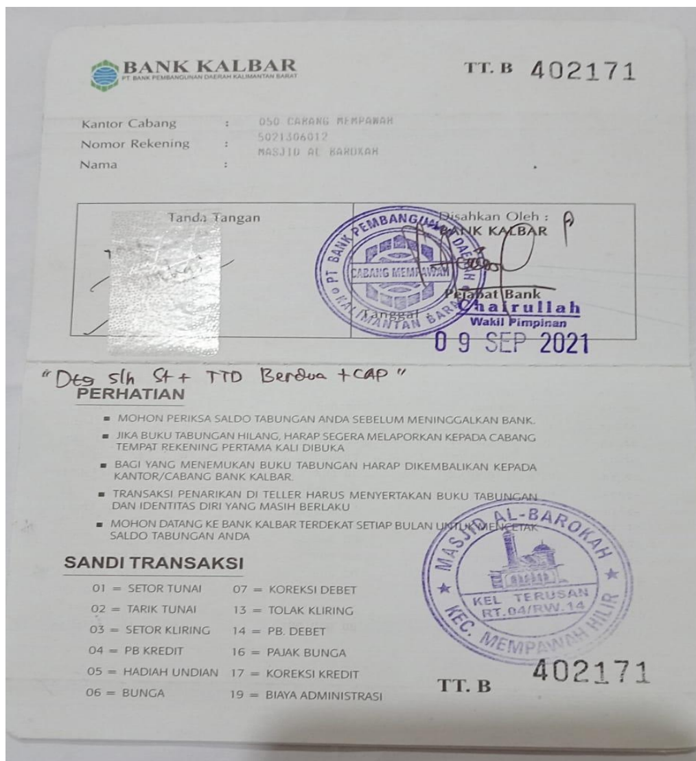
FOTO REKENING MASJID BANK KALBAR